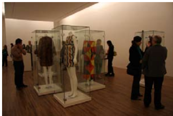
VISITA AO IAC

A próxima SP Arte já tem data marcada: de 29 de abril a 02 de maio de 2010.