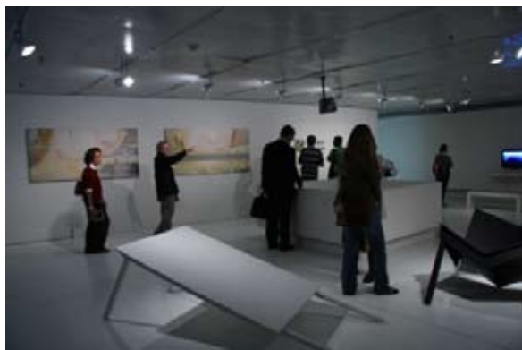
VISITA AO ITAÚ CULTURAL - RUMOS ARTES VISUAIS