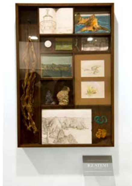
OBRA DE JOÃO MODÉ DOADA PELO IGUATEMI À PINACOTECA A GENTIL CARIOCA