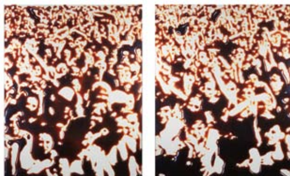
OBRA DE VIK MUNIZ ARTE 57