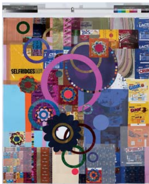
OBRA DE BEATRIZ MILHAZES GALERIA ALMEIDA & DALE