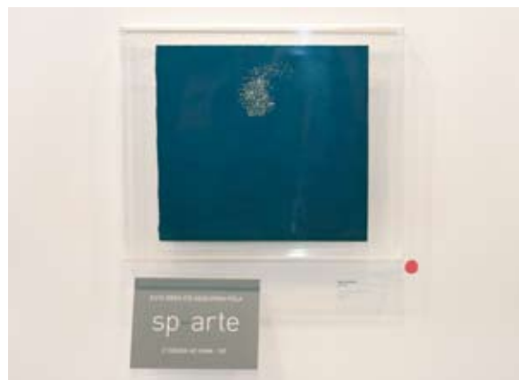
OBRA MIRA SCHENDEL DOADA PELA SP-ARTE AO MAM-SP ATHENA GALERIA DE ARTE